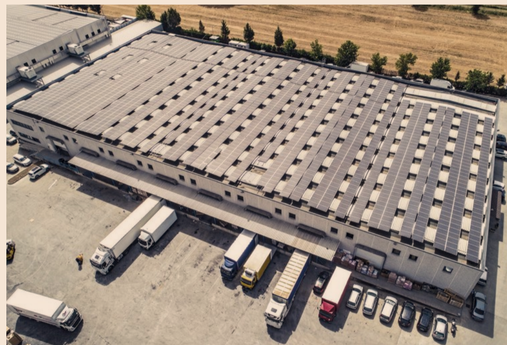
FILIALE DI RENDE (CS)

Il 25 gennaio 2025 Cdr festeggerà i sessant'anni di attività celebrando il lavoro, la dedizione e la visione di un'azienda che è riuscita a trasformare un piccolo garage di Carini in una grande realtà senza mai perdere di vista le proprie radici. Con questo anniversario Cdr conferma un impegno per il futuro forte della propria storia, pronto a costruire nuovi successi e a scrivere altri capitoli di questo viaggio straordinario. ■